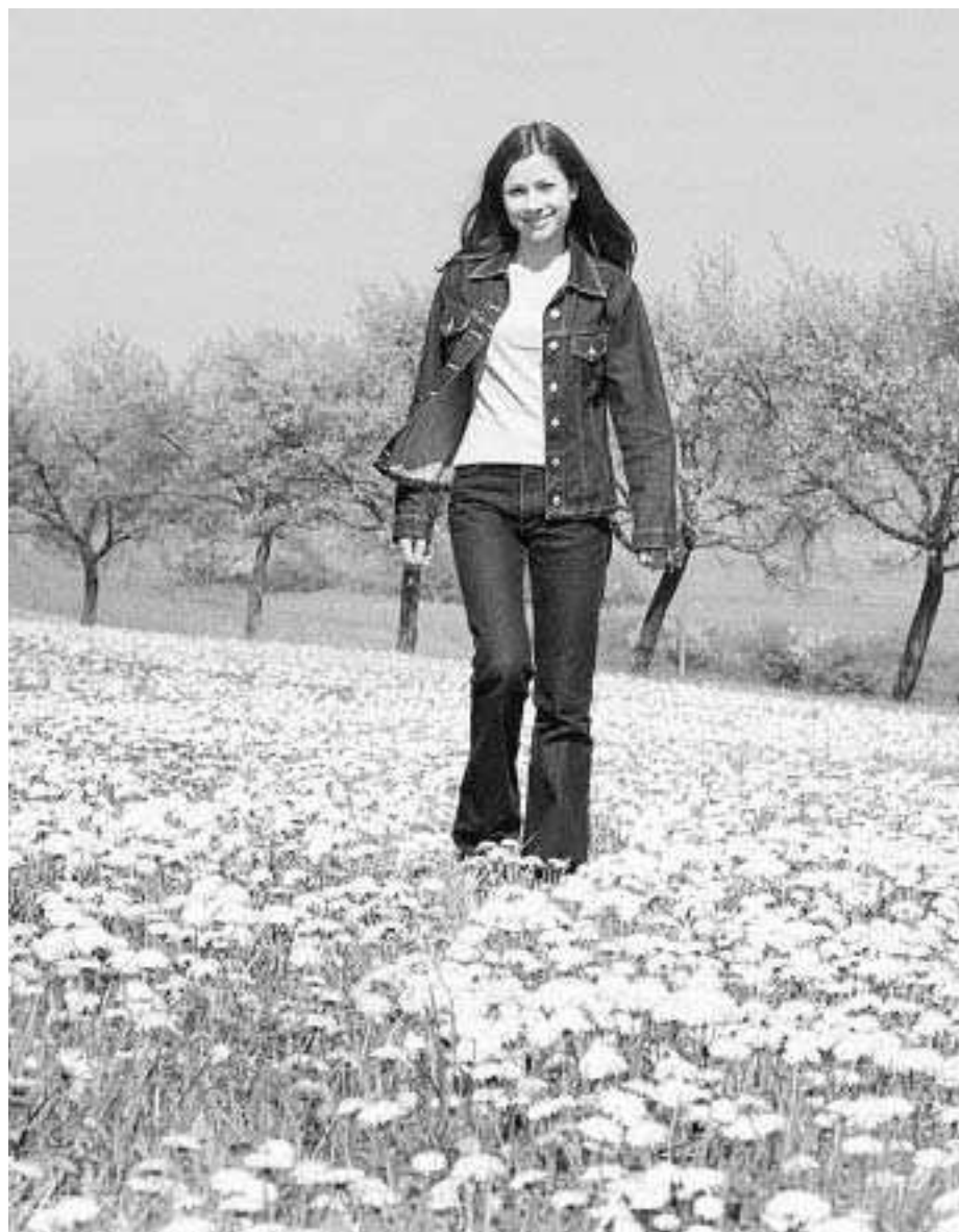
Mit der Natur rund Bebelshem befasst sich das nächste Heimatbuch.

Heimatfreunde arbeiten am nächsten Band der „Bebelsheimer Geschichte“