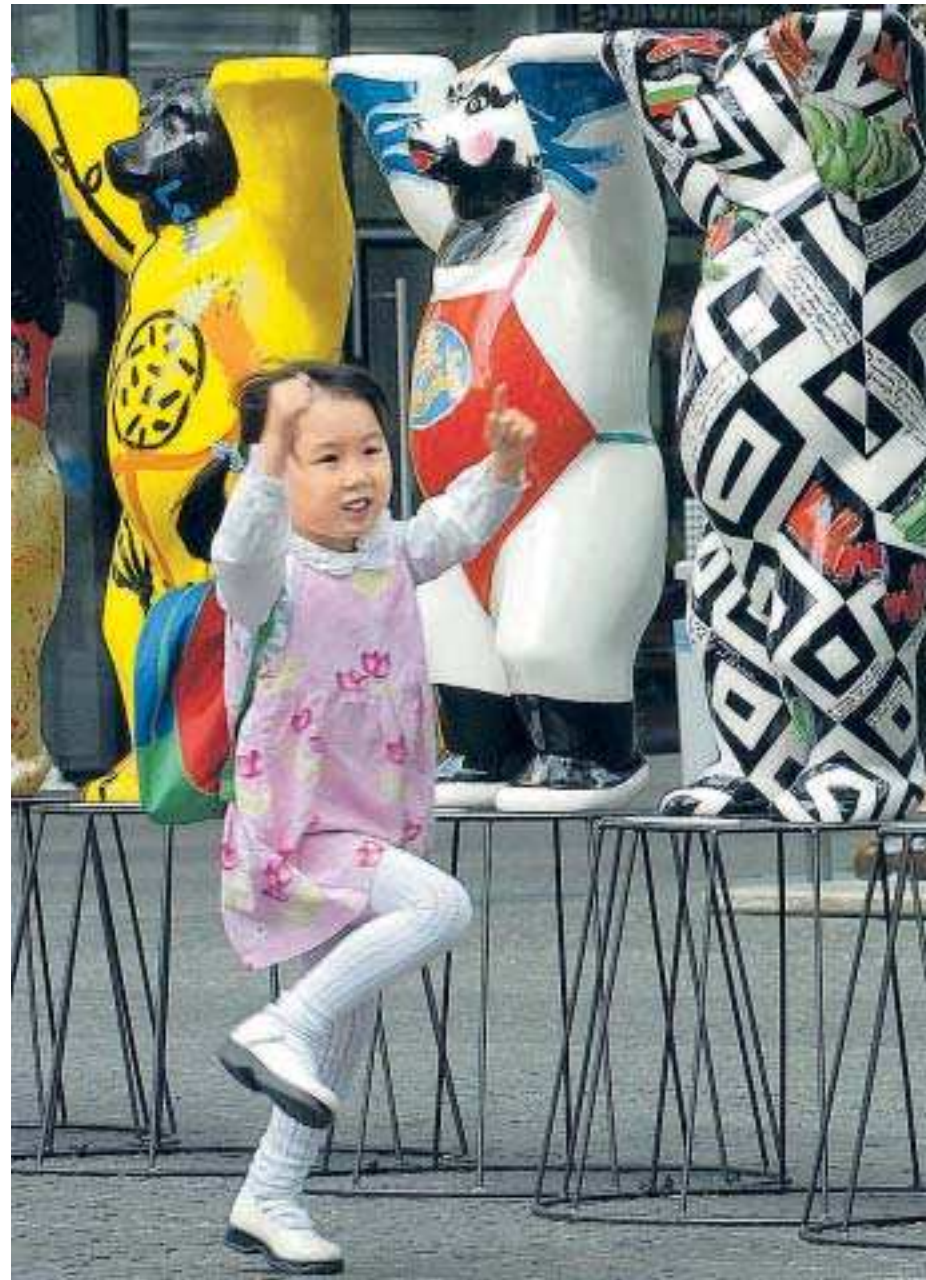
Bunte Botschafter aus Berlin werben ab Samstag in Hongkong für Toleranz und Verständigung. Die Bären aus Fiberglas, die zu Hunderten in der deutschen Hauptstadt stehen, gelten dort als Symbole der Freundschaft und Offenheit. Asiens Filmstar Jackie Chan hatte die Figuren in Berlin entdeckt und beschloss, 125 Exemplare in seine Heimatstadt einfliegen zu lassen.